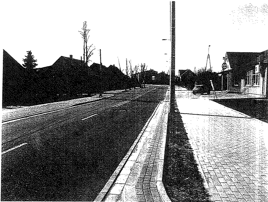
Zdjęcie nr 3. Ulica Dubiażyńska z dobudowaną ścieżką rowerową