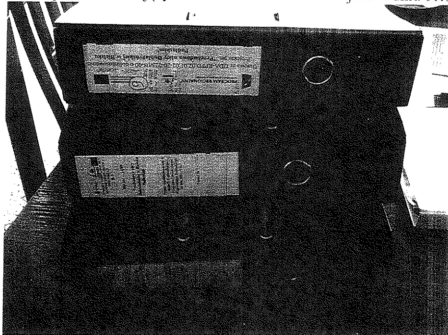
Zdjęcie nr 7. Segregatory z dokumentacją dotyczącą Projektu

Zdjęcie wykonane przez kontrolujących w trakcie kontroli na miejscu w dniu 11.04.2011 r.: