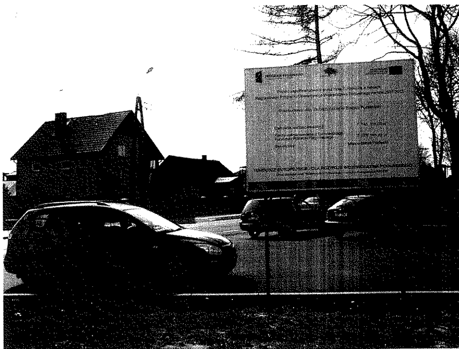
Zdjęcie nr 6. Tablica pamiątkowa

Zdjęcie wykonane przez kontrolujących w trakcie kontroli na miejscu w dniu 11.04.2011 r.: