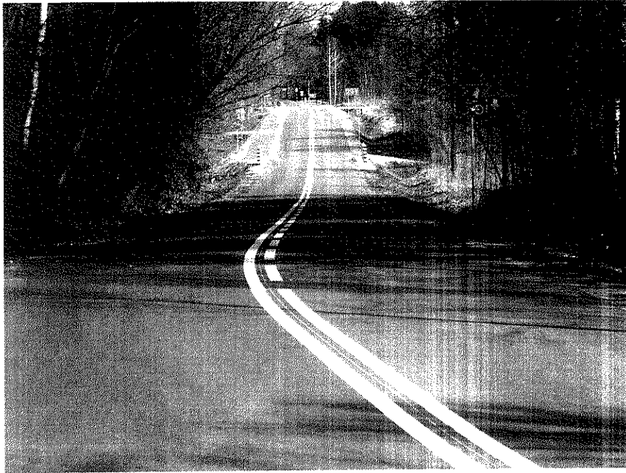
Zdjęcie nr 5. Ulica Dubiażyńska