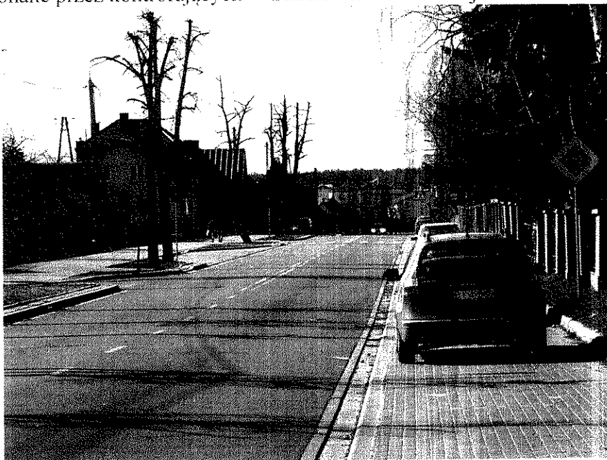
Zdjęcie nr 1. Ulica Dubiażyńska

Zdjęcia wykonane przez kontrolujących w trakcie kontroli na miejscu w dniu 11.04.2010 r.: