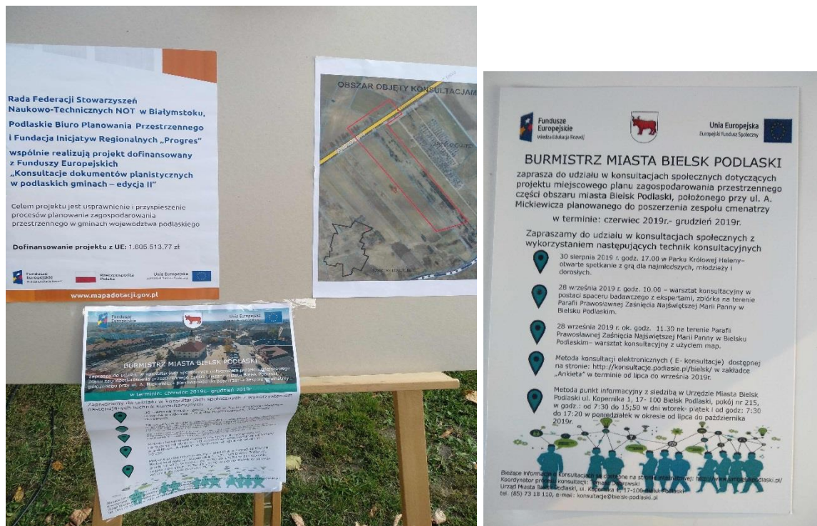
Oznakowanie projektu, mapa poglądowa, plakat informacyjny, broszura

W ramach przyjętej metody uczestnikom przedłożono do wypełnienia ankietę w której m in. pytano o preferowany sposób zagospodarowania terenu dla konsultowanego obszaru a także przeprowadzona została gra konsultacyjna, w której rodzice i dzieci oraz osoby dorosłe, mogły zaznaczyć na mapie Miasta Bielsk Podlaski miejsca, w których powinny znaleźć się potrzebne dla nich lokalizacje.