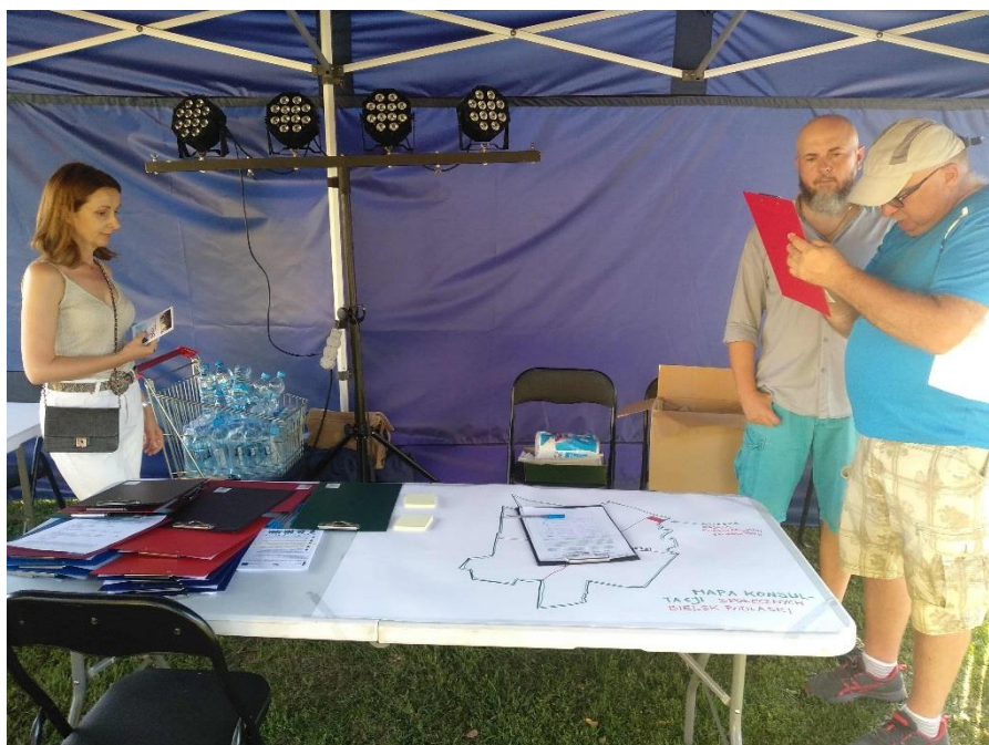
Wygląd namiotu konsultacyjnego