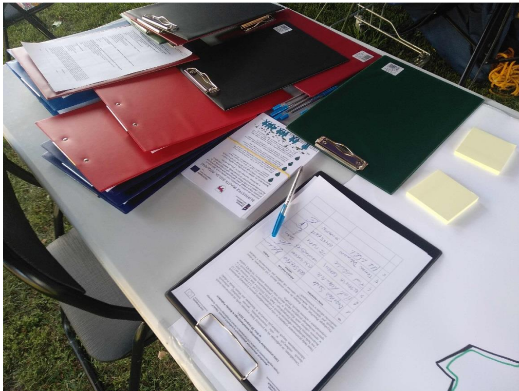
Stół konsultacyjny z ankietami i lista obecności