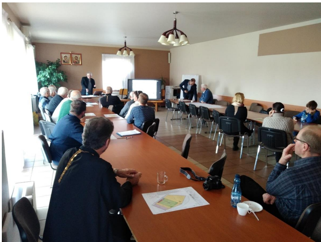
Prelekcja podsumowująca spacer badawczy