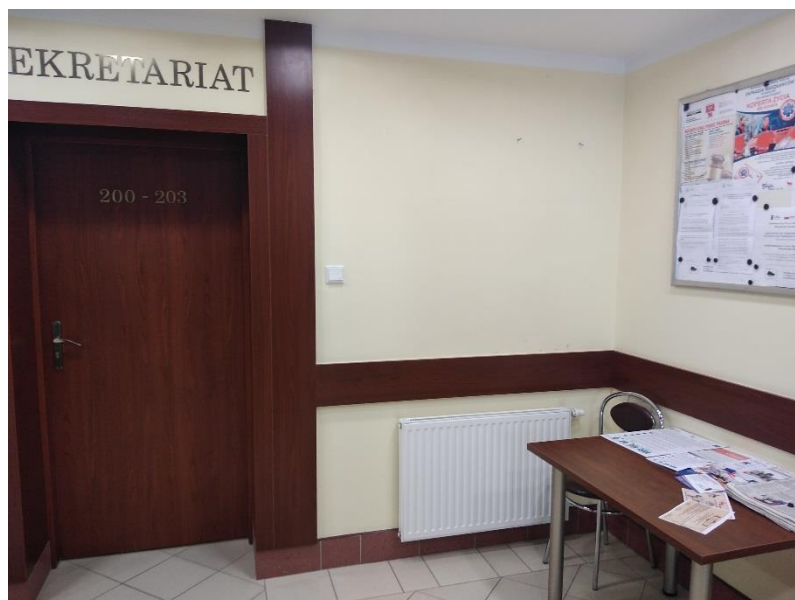
Materiały informacyjne przy sekretariacie Urzędu Miasta