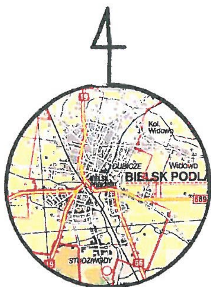
SZKIC ORIENTACJI SKALA 1:130000